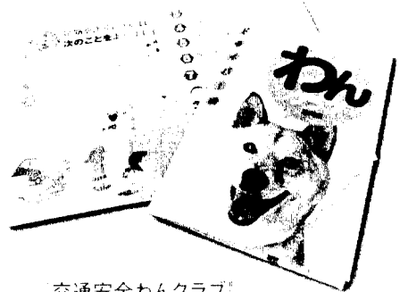
交通安全わんクラブ (静岡県くらし交通安全課監修)

地域の話題や生活に役立つ情報をきめ細かく伝える、まちのラジオ局として、静岡市民に交通ルールや交通マナーの遵守を呼びかけているほか、静岡県くらし交通安全課監修による小冊子「交通安全わんクラブ」の配布も行っている。「ラジオを通じて大勢の人たちに、少しの注意と思いきやりを心がけることで