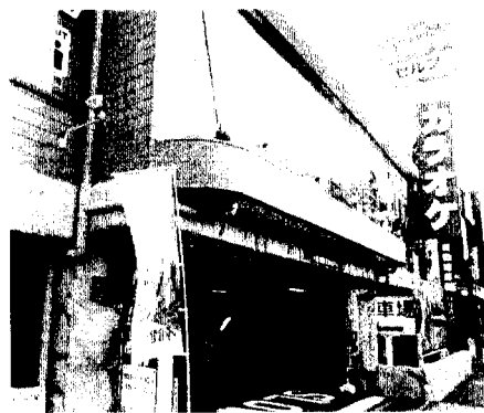
「タイムズ・カラオケパーク ベスト10」

新業態店は、飲食をすべて持ち込み可としてフロントに軽食やドリンクの自販機を設置。料金も10分、15分、100円(時間帯により異なる)と低価格で分かりやすくした。スタッフ業務も少なく、特別なノウハウがなくとも十分に異業種から参入できるビジネスだけに、今後地方への普及も加速していくと見込んでいる。 問い合わせ、054-645-0707