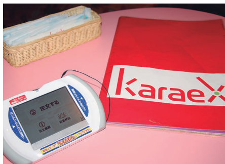
「スーパースター NAVI」導入後、注文の100%近くがセルフオーダー端末によるものだという