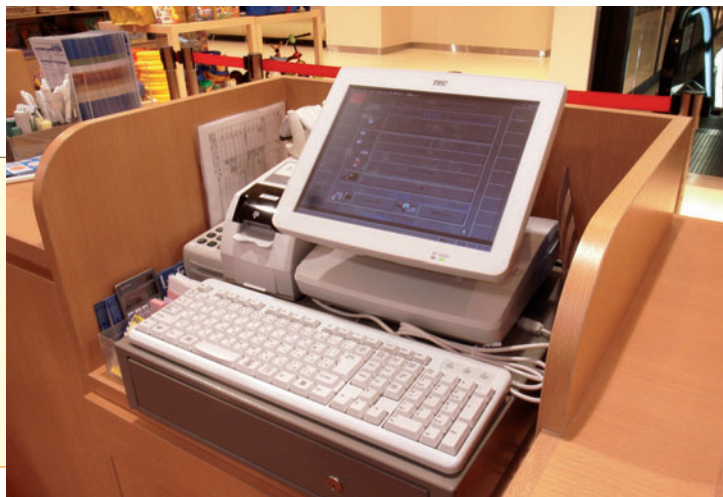
施設のオペレーションに合わせたカスタマイズ対応など、より戦略的・効率的な運営をサポートする「スーパースターシリーズ」